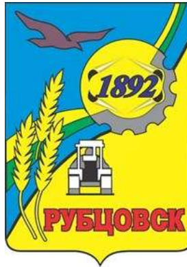
Схема теплоснабжения муниципального образования город Рубцовск Алтайского края на период до 2035 года (актуализация на 2025 год)